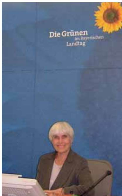
Das DGHS-Mitglied Barbara Rütting bei einer Podiumsdiskussion in München. Sie war Alterspräsidentin des Bayerischen Landtags.