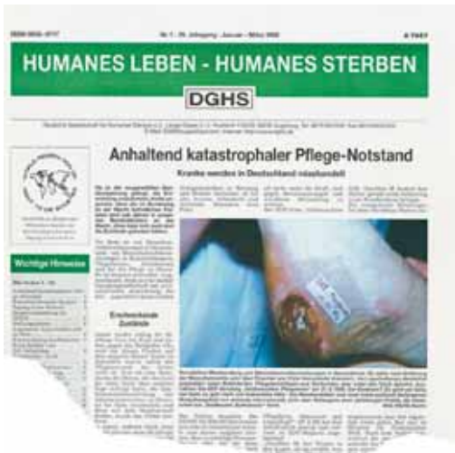
Pflegenotstand als Dauerthema in Deutschland. Hier die HLS-Titelseite 1999-1.