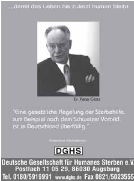
Das DGHS-Prominenten-Mitglied Prof. Peter Glotz ermuntert zu einer gesetzlichen Regelung in Deutschland nach Schweizer Vorbild.