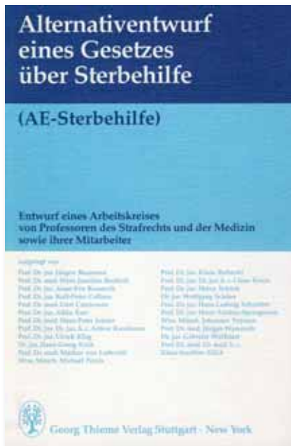
Dieser Alternativentwurf wurde zum Deutschen Juristentag 1986 vorgestellt, konnte sich jedoch nicht durchsetzen.

Die DGHS ist seit Jahren Mitglied beim DEUTSCHEN JURISTENTAG (DJT), zumal spätestens im Jahre 1986 erkennbar wurde, dass sich dieses wichtige Gremium intensiver Gedanken für den Gestaltungsbedarf auf Gesetzgeber-Ebene machte. Denn der DJT 1986 erwirkte in einer Art Sondervotum den ALTERNATIVENTWURF (AE) Sterbehilfe, mit dem namhafte Juristen wesentlich das forderten, was damals schon die DGHS in ihrem Forderungskatalog hatte: eine Novellierung im Strafrecht im Sinne humanerer Sterbewirklichkeiten.