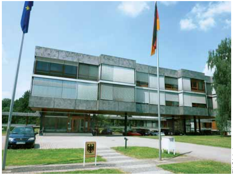
Die Verfassungsrechte stehen über anderen Gesetzen und gelten unmittelbar – also nicht nur theoretisch als Papiertiger. Hier das Bundesverfassungsgericht in Karlsruhe.

Die überzeugende Kraft humanitärer Gedanken und Aufklärung beflügelten jedoch immer wieder einzelne Menschen, sich für die übergeordneten Ziele der Menschen- und Bürgerrechte einzusetzen und Seelenverwandte zu suchen. Spätere Generationen werden sich aus dem Abstand der Jahre ein klareres Bild davon machen können, was tatsächlich uns Menschen im Verständnis und Umsetzungsprozess für ein humaneres Sterben stärkte