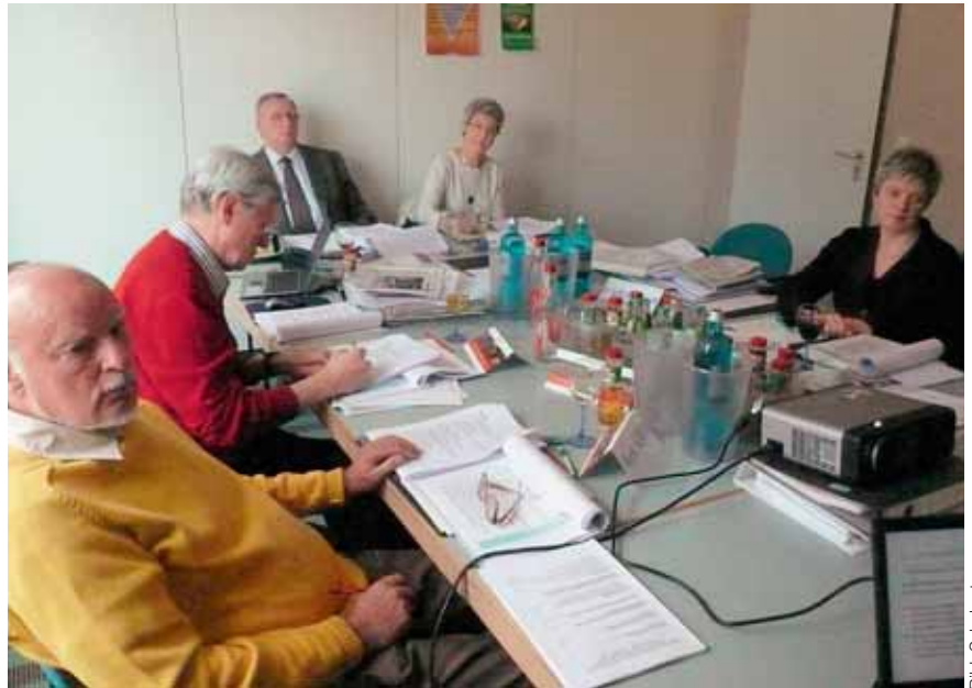
Präsidiumsmitglieder bei der ehrenamtlich anspruchsvollen Arbeit; hier während einer Strategie-Konferenz am 28.2.2009 in Augsburg.

ganisation, die bundesweit dann am Tag des Inkrafttretens des Betreuungsrechts ihren Mitgliedern Formulare anbot, die Abertausende schließlich ausfüllten und in der DGHS-Zentrale archivieren ließen. Die AUFKLÄRUNG der DGHS konzentrierte sich jedoch nicht nur auf das Lebensende. Vielmehr erkannten die Verantwortlichen, dass der Mensch möglichst schon in jungen und gesunden Tagen Vorsorge treffen sollte, nicht nur für die letzten Lebensstunden, sondern für den meist jahrelangen letzten Lebensabschnitt, in dem die Kräfte häufig nachlassen. Die DGHS förderte vorausschauendes Denken und Handeln; sie setzte sich immer wieder für rechtzeitig ausgefüllte und rechtskräftig unterschriebene Betreuungsverfügungen, Patientenverfügungen, Vorsorgevollmachten, Organspende-Zertifikate, Willensverfügungen zu Fragen der Organentnahme oder beispielsweise – seit 2008 – für das rechtzeitige Abfassen einer ergänzenden Demenzverfügung ein.