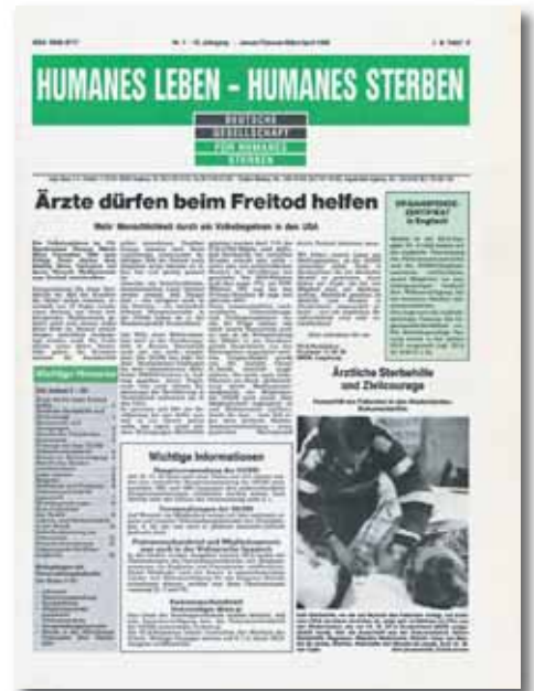
Ein internationaler Durchbruch des Menschenrechts auf einen frei gewählten Tod gelang Mitte der 90er Jahre in Oregon/USA durch eine gesetzliche Regelung des ärztlich begleiteten Suizids, die auch Vorbild für Europa sein könnte. Titelseite von HLS 1995-1.

Antrag 1 (zu These 5 GA Prof. Verrel) Der Gesetzgeber soll ein umfassendes Sterbebegleitungsgesetz unter Beachtung verfassungsrechtlicher Rahmenbedingungen mit Stärkung des Praxisbezugs unter Berücksichtigung von Sorgfaltskrite-